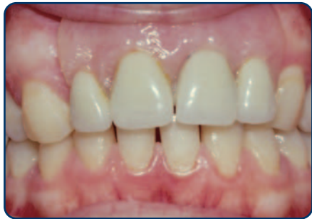
Plaatprothese van voren

De plaatprothese is gemaakt van een roze, tandvleeskleurige kunsthars. Daarin zijn de kunsttanden en -kiezen verankerd. De gehele plaatprothese rust op het slijmvlies van de mond. Deze zit eventueel met ankertjes vast aan overgebleven tanden of kiezen.