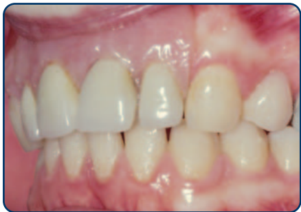
Plaatprothese van opzij