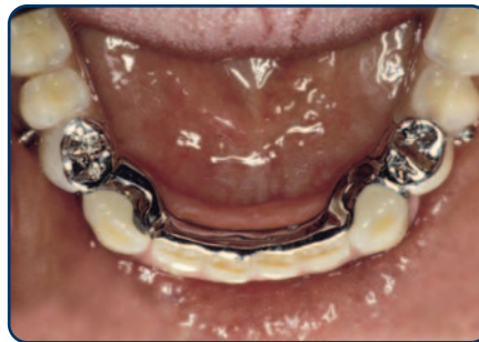
Frameprothese met verankering op kronen