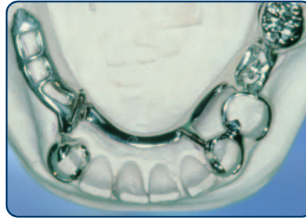
Frameprothese in wording op een gipsmodel, zonder kunsttanden en -kiezen

soort slotje. Bij een slotje wordt de ene kant vastgemaakt aan een kroon, tand of kies en de andere kant zit vast aan de frameprothese. De frameprothese kunt u op die manier in het slotje schuiven. Het slotje zit doorgaans aan de binnenkant van de tanden en kiezen en is dus niet vanaf de buitenkant zichtbaar. Ankertjes zijn vaak wel enigszins zichtbaar.